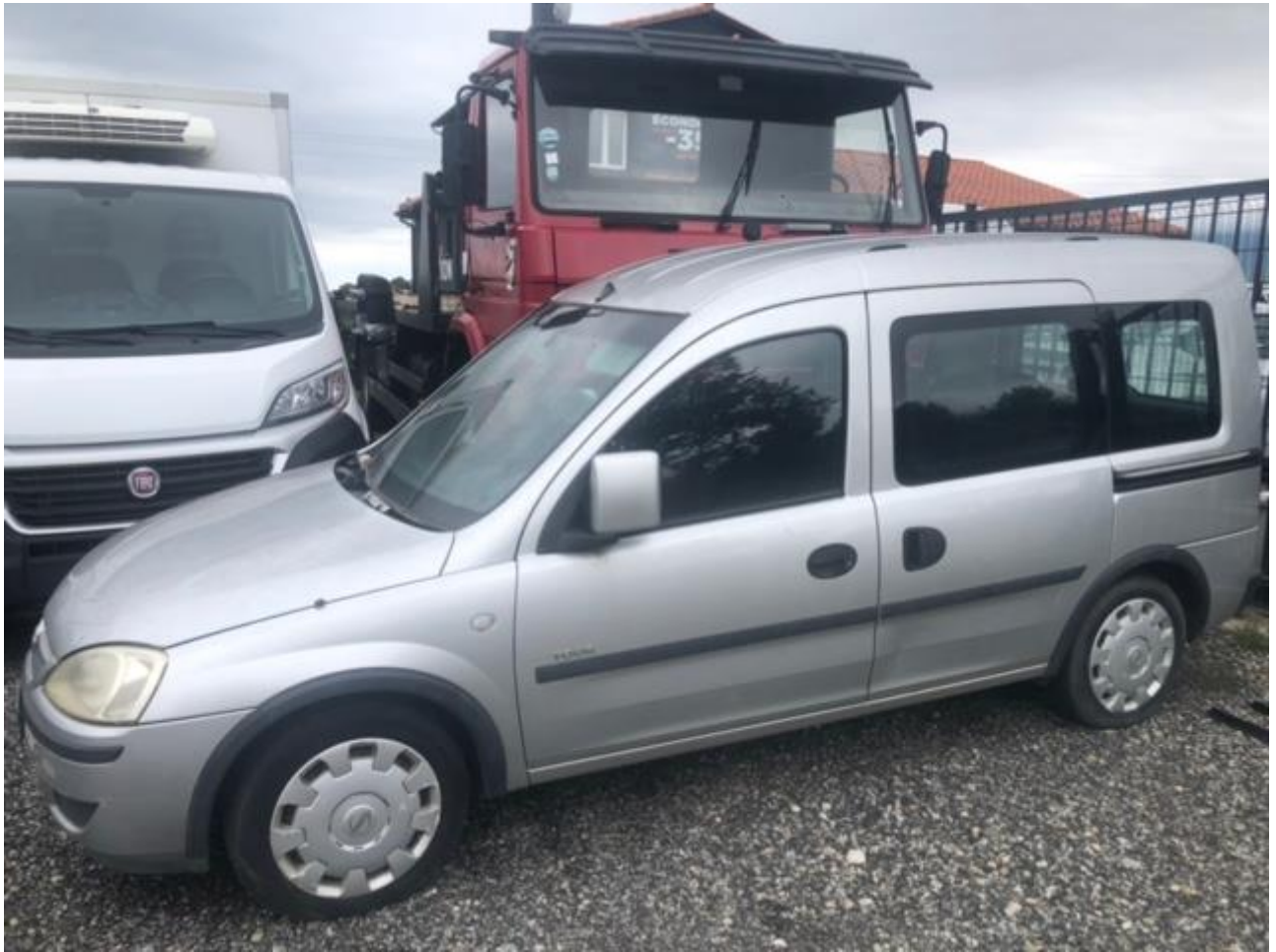
- Un véhicule de marque SANTANA immatriculé HU3114J